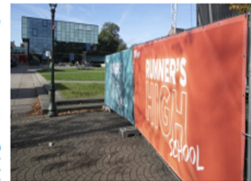
Runner's High mikt op de leerlingen uit het vijfde en zesde middelbaar.

De studenten sport- en cultuurmanagement en het docententeam mikken dus op de leerlingen uit het vijfde en zesde middel-