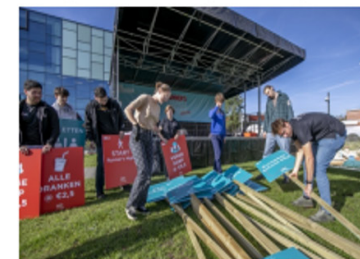
De studenten werkten gisteren aan de opbouw van het loopfestival.

Het evenement is een verplichte schooluitstap voor de leerlingen. Ze komen tijdens de schooluren samen met de leerkrachten naar het loopfestival. De scholen die zich hebben ingeschreven, maken de leerlingen alvast warm voor hun deelname. “De ingeschreven leerlingen leggen in samenspraak met hun leerkracht een afstand van drie, vijf of tien kilometer af.